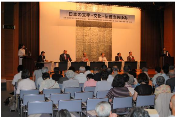
シンポジウム「日本の文字・文化・伝統の歩み」