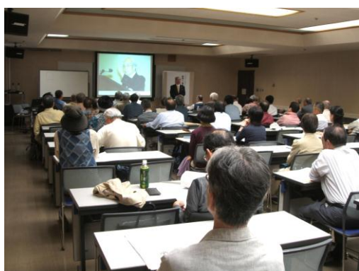
漢字普及講座（京都）

漢字普及講座、講習会、漢字パネル展等、シンポジウムを一般及び親子に対して、京都、愛知、福井の各地で開催致しました。