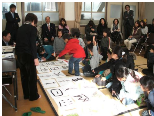
親子対象漢字講習会（京都）