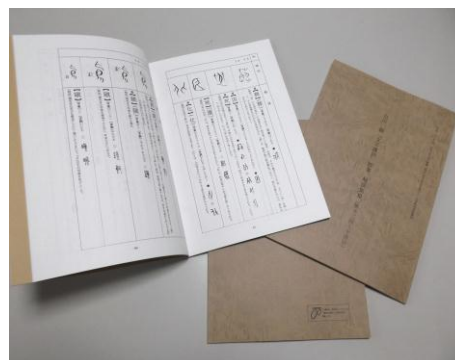
一般対象教本「板書解説集」